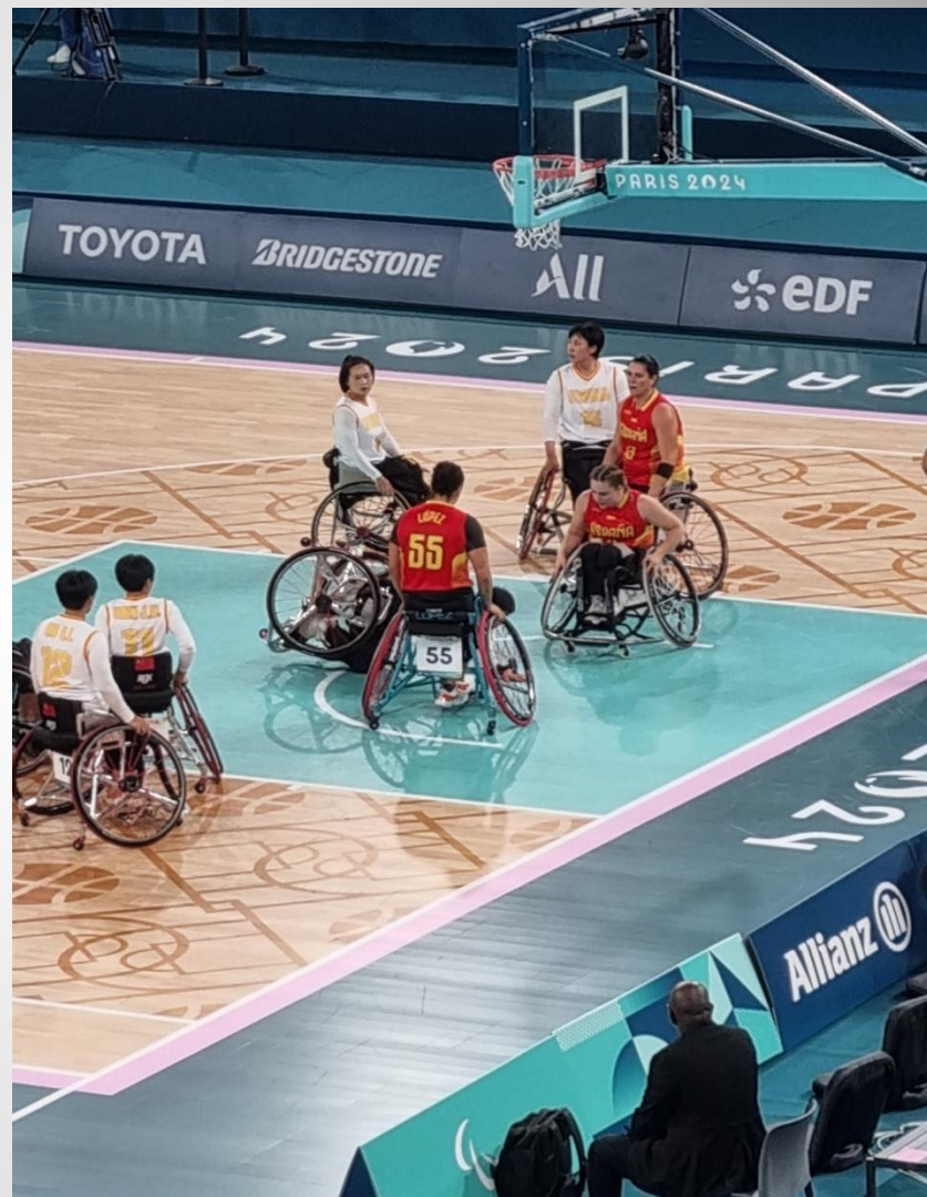
40 mn spectaculaires, victoire de la Chine 64 - 38